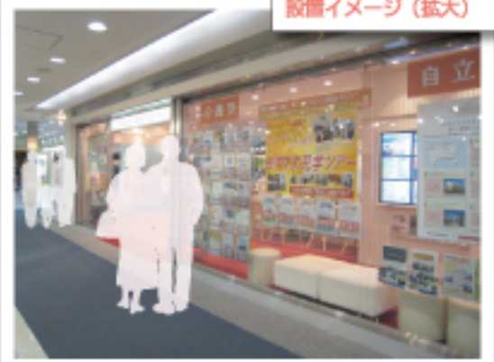
店頭カタログ設置イメージ

よみうり文化センター横浜が当施設に隣接しており、高齢者のお客様の人通りが大変多いフロアです。