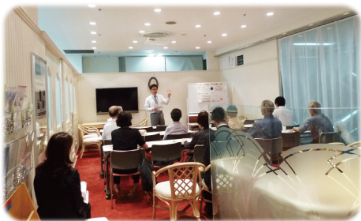
▲定期的に開催されるセミナー風景

○設備・・・52インチ液晶テレビ（DVD等を流せます）・ホワイトボード 店内B0サイズポスターパネル×2箇所