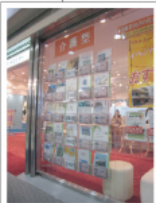
設置イメージ (拡大)

よみうり文化センター横浜が当施設に隣接しており、高齢者のお客様の人通りが大変多いフロアです。